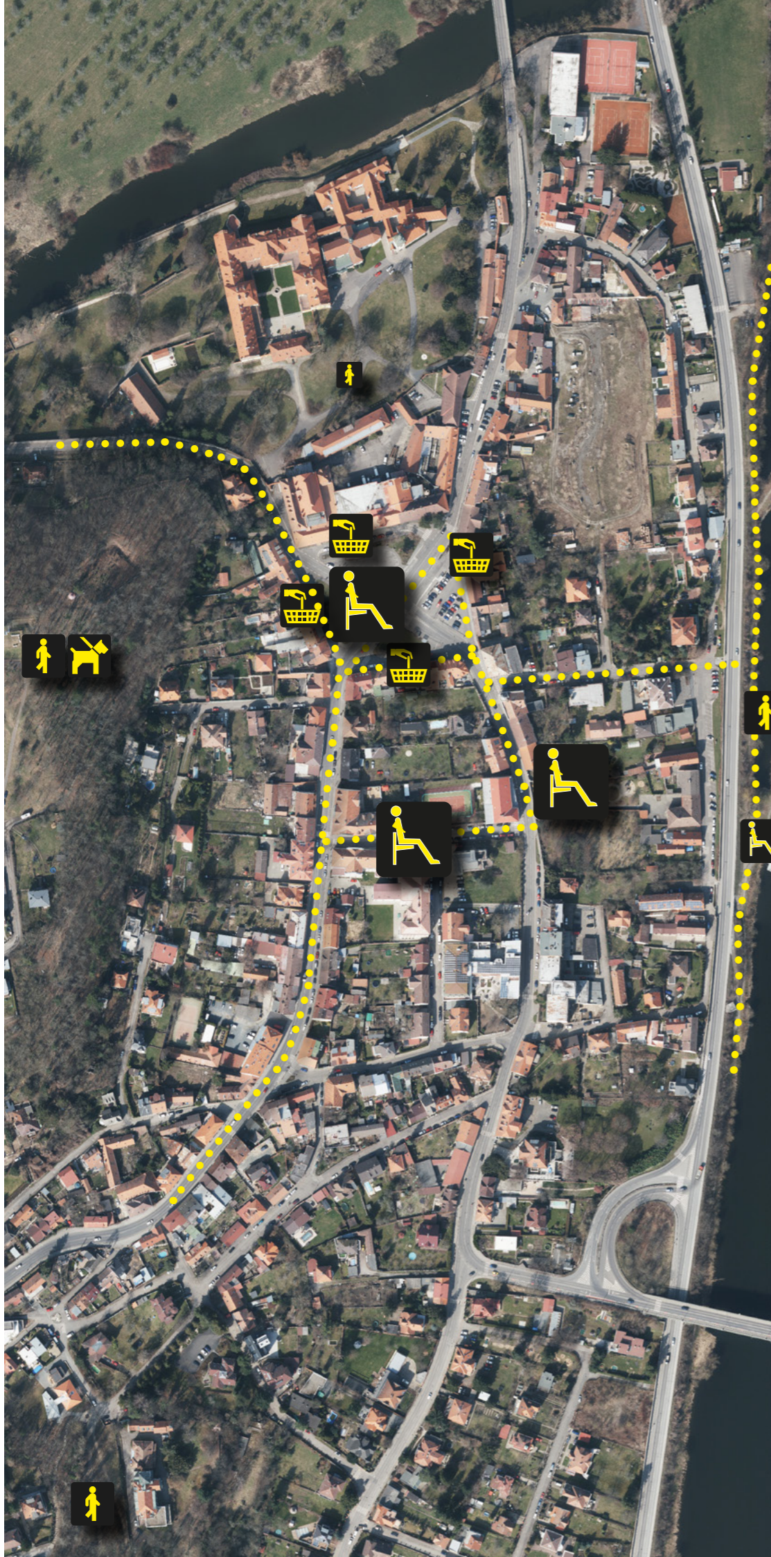
Schéma využití (velikost piktogramu odpovídá návštěvnosti míst) a hlavních pěších spojení