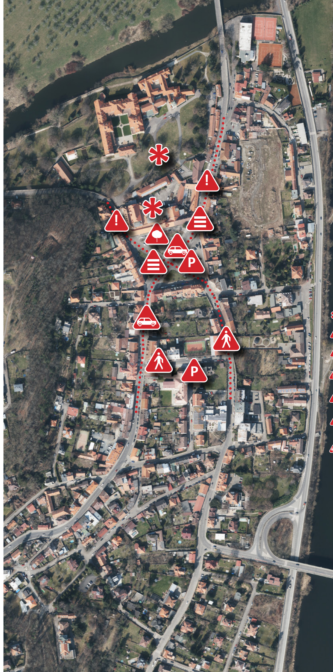
Schéma problémů s přímým umístěním